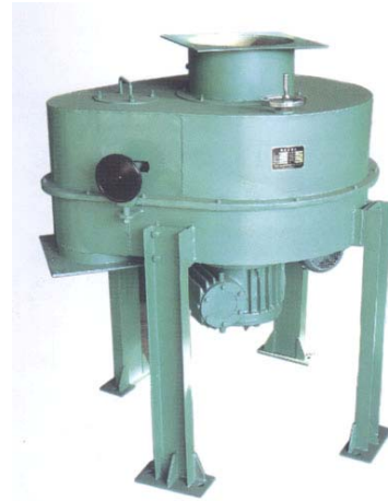
DB 型外形及安装参考尺寸